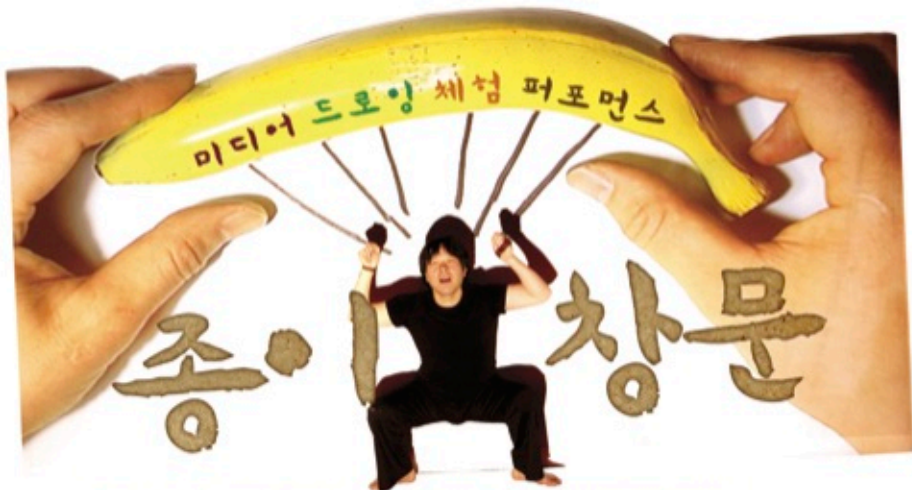
그림 속으로 들어간 사람! 그 특별한 위트, 유쾌한 상상력과 만나라!

예술간 장르간의 통합과 조화가 만들어내는 특별함! 모두가 무대의 주인공이 되어보는 최고의 공연! 멀티미디어 공연예술의 새로운 체험! 2009년 "SBS 스타킹"과 "KBS TV 유치원 하나둘셋"에 특별초청공연으로 전격 출연하면서 예술성과 함께 대중성을 동시에 확보한 공연! 새하얀 벽, 아무 것도 일어나지 않을 것 같은 그 조용한 공간에 거대한 환상의 스케치북이 펼쳐진다. 화가가 축석에서 그려내는 그림이 새하얀 벽에 커다란 영상으로 펼쳐지고, 그 환상의 스케치북 속으로 공연자와 관객이 함께 뛰어들어 여행을 떠난다. 디지털과 아날로그, 연극과 회화, 무대와 관객이 경계를 허물고 하나가 되는 특별한 시간!